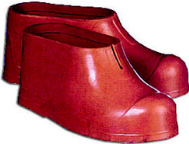
Коврик резиновый диэлектрический

Коврики используются как дополнительное средство защиты в электроустановках всех классов напряжений, но только при сухих условиях работ.