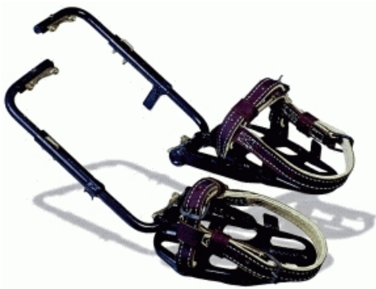
Лазы монтерские ЛМ-3

Предназначены для подъема на железобетонные опоры трапециевидального сечения типа СВ-105 линий электропередачи ЮкВ и типа СВ-95 линий электропередачи 0,4 кВ и работы на них.