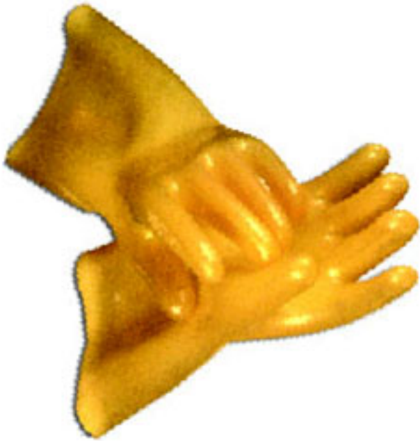
Перчатки диэлектрические шовные