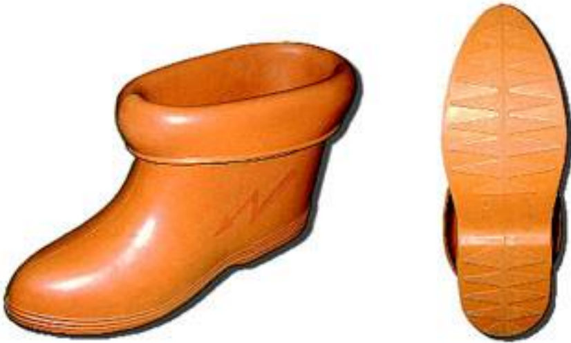
Галоши диэлектрические (исп. 15кВ)