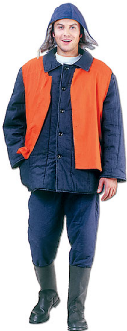
Жилет «Дорожник» (мод. 17С2)